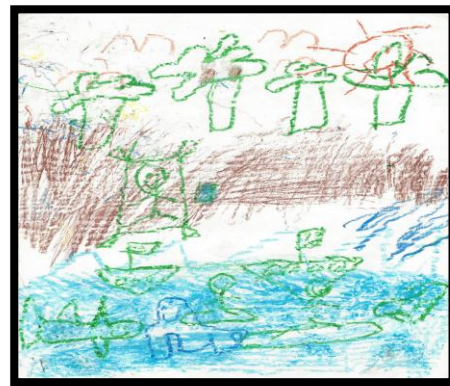
Figura 4. Durante el desastre