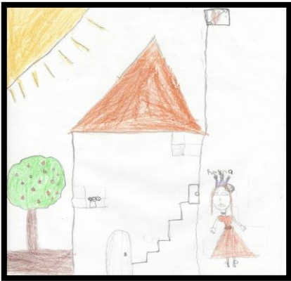
Figura 7. Posterior al desastre