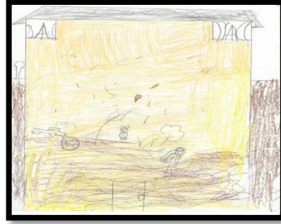
Figura 6. Durante el desastre