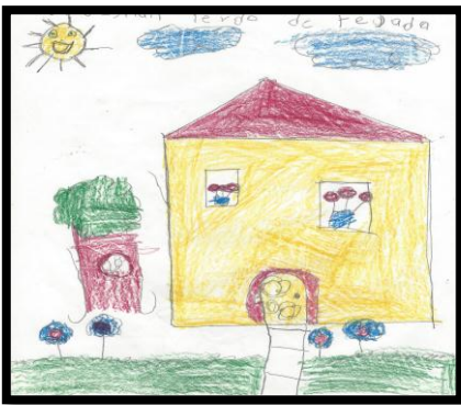
Figura 1. Antes del desastre

Dibujo Libre. Los 122 dibujos se agruparon en tres momentos: antes, durante y después del desastre. Reflejan de manera evidente las emociones y sentimientos en cada uno de ellos. Expresaron verbalmente los qué, cómo, donde, quienes... en relación con lo plasmado en sus hojas.