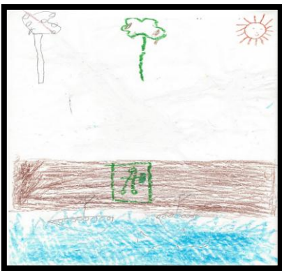
Figura 3. Durante el desastre