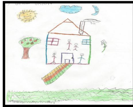
Figura 2. Antes del desastre