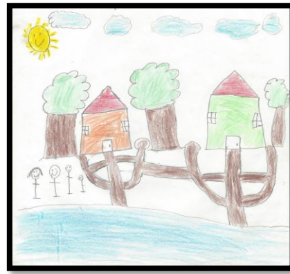
Figura 8. Posterior al desastre

Los resultados muestran que los niños en cada uno de los dibujos hacen alusión a sus vivencias durante la inundación. A través de esta técnica pudieron revelar sus estados de ánimo, los miedos y sentimientos que tuvieron durante y después del desastre ocurrido.