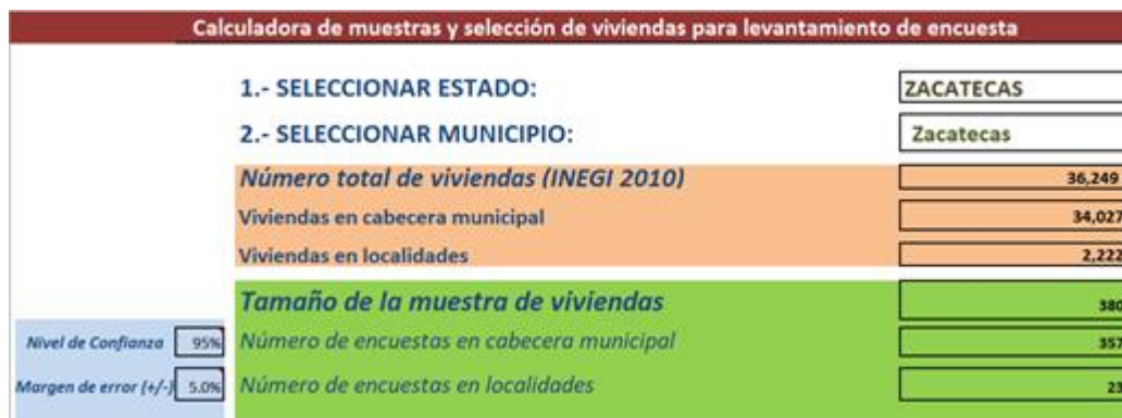
Figura 1. Calculadora de muestras y selección de viviendas para levantamiento de encuestas

Nota: Elaboración propia con base en la calculadora de muestra proporcionada por el INAFED (2019)